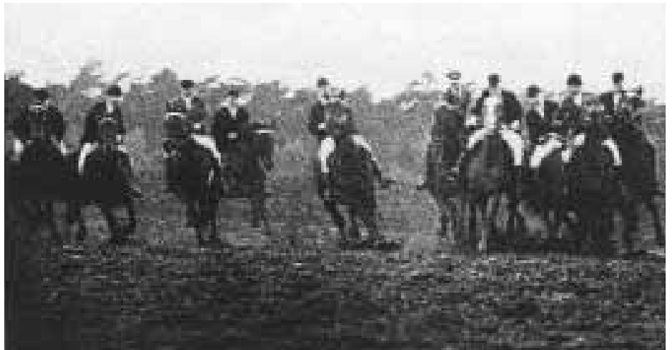
Reiten – Reiten – Fuchsschwanzgreifen

konnte. Der sollte von links kommen, und über die linke Schulter des Verteidiger greifen. Sonst gab es wenige Vorschriften. „Von links anreiten!“ waren die letzten Zurufe an die Davonbrausenden. Ein Brüderpaar hatte zwei windschnelle Pferde. Sie hatten sich eine Taktik ausgedacht. Der Jüngere hielt sich rechts neben dem Verteidiger, eine Nasenlänge vor ihm, so konnte der nicht abschwanken. Der Ältere holte vorschriftsmäßig von links auf, aber der Fuchsschwanzreiter bückte sich nach Kosakenmanier tief in die rechte Flanke seines Pferdes. Wieder ein Anlauf - vergebens. „Schmeiß dich rüber“ hallte die laute Stimme seines Bruders. Den Zuschauern stand der Atem