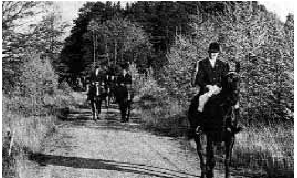
Der Fuchsschwanzverteidiger führt die Kavalkade